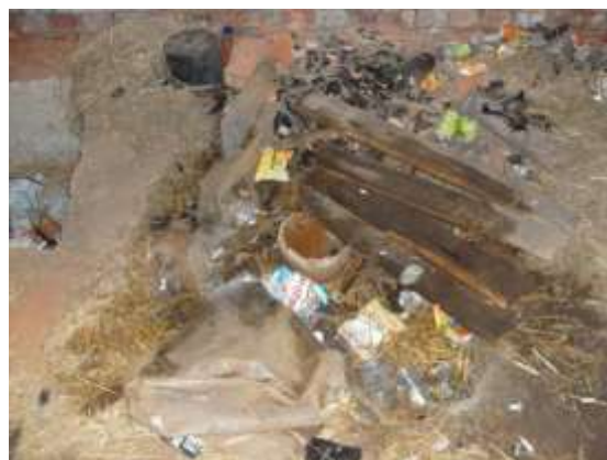
Фото 13.1-2. Открытое устье бесхозной скважины № 1941 с. Ильинское 1

Качество воды в большинстве скважин неизвестно. В отдельных скважинах отмечается повышенная интенсивность запаха, что может быть вызвано как загрязнением подземных вод,