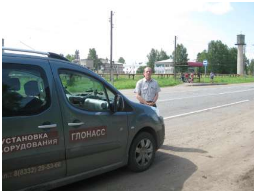
Фото 14-1. Автодорога Слободской – Белая Холуница проходит по северной границе с. Ильинского