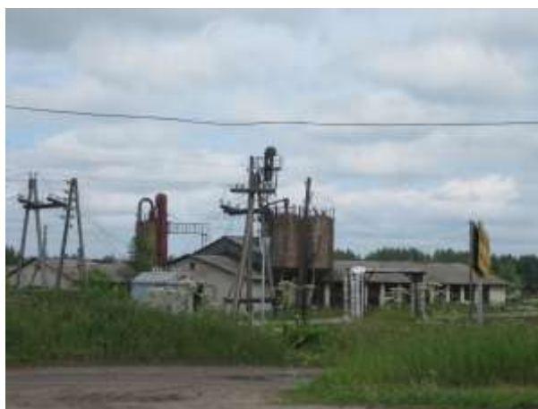
Фото 13.2-1. Бывший зерносушильный комплекс.

Проекты границ СЗЗ для данных объектов разработаны не были. Границы СЗЗ объектов определяются классами их санитарной опасности. Согласно «Правил землепользования и застройки муниципального образования «Ильинское сельское поселение Слободского района Кировской области», для объектов, расположенных на бывшем машинном дворе, приняты радиусы СЗЗ 300 м, вследствие чего в СЗЗ попадает жилая застройка по ул. Боровая, Кооперативная, Луговая, Школьная, Полевая, в т.ч. дом культуры. В СЗЗ комплекса крупного рогатого скота, для которого также установлен радиус СЗЗ 300 м, попадают жилые дома по ул. Строителей.