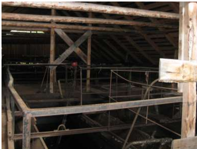
Фото 13.1-1. Блок ОСК в с. Ильинское.

Сведения о качестве воды в других водных объектах, в т.ч. в р. Талица, используемой в рыболовном хозяйстве, отсутствуют.