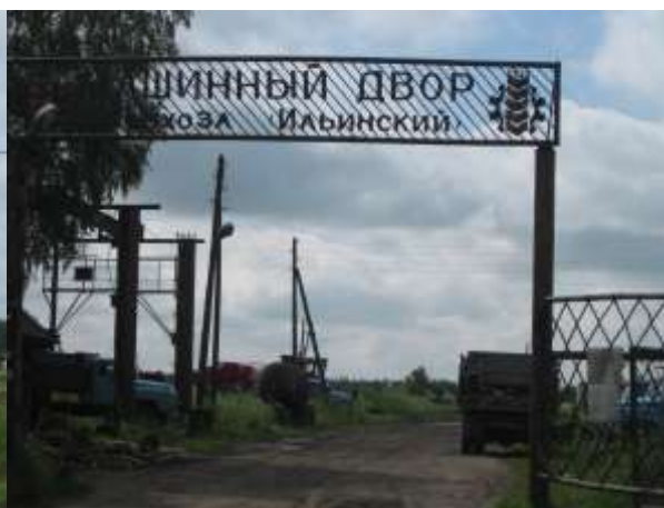
Фото 13.2-2. Машинный двор СПК «Ильинский».