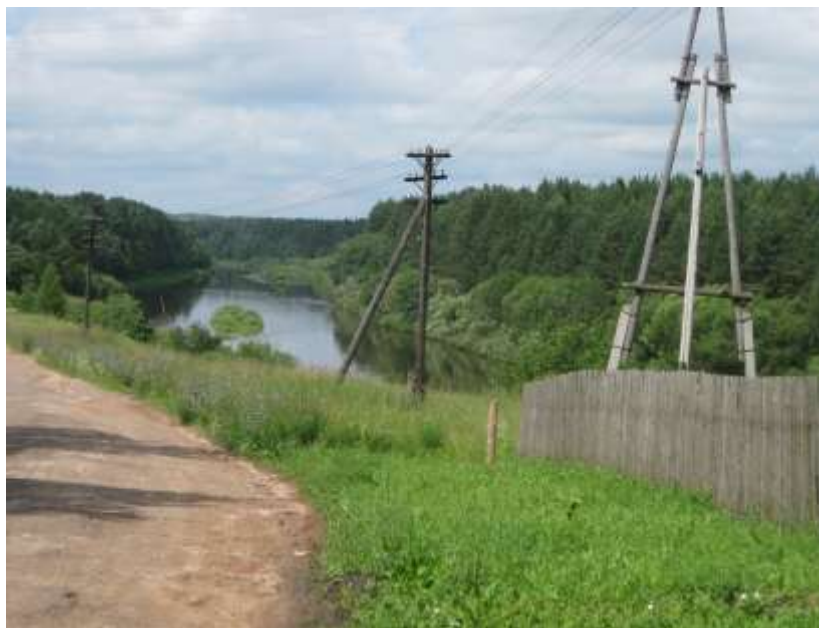
Фото 3.5-1. Вид на р. Белая Холуница.

К наиболее благоприятным геокомплексам относят всхолмленные и волнистые участки с сосновыми лишайниковыми и кустарничково-зеленомошными лесами, расположенные близ рек. Такие территории, обладающие широким набором рекреационных возможностей, расположены на крайнем востоке Слободского района, в Ильинском СП, по реке Белая Холуница 19 .