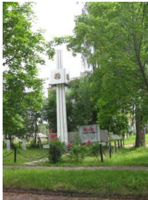
Фото 13.2-3. Сквер по ул. Строительной.

Важное значение с точки зрения охраны окружающей среды имеет существующее озеленение прибрежной полосы р. Белая Холуница и вдоль автодороги Слободской - Белая Холуница. Это озеленение целесообразно расширить на другие кварталы, как это было предусмотрено Генеральным планом села от 1978 г.